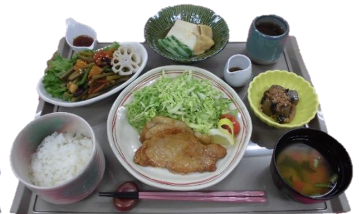
豚肉の生姜焼き、豆腐と水菜の煮物、 ごろごろ野菜と金平サラダ、味噌汁、 こんにゃくの当座煮、御飯