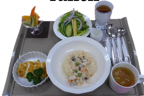
ピラフとエビクリーム煮、チキンのピカタ、 グリーンサラダ、果物、スープ