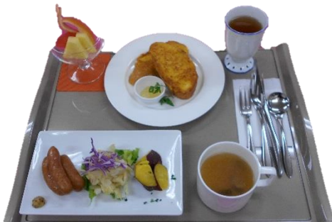
りんご風味のフレンチトースト、果物、スープ ポイルウインナーと簡単ザワークラウト