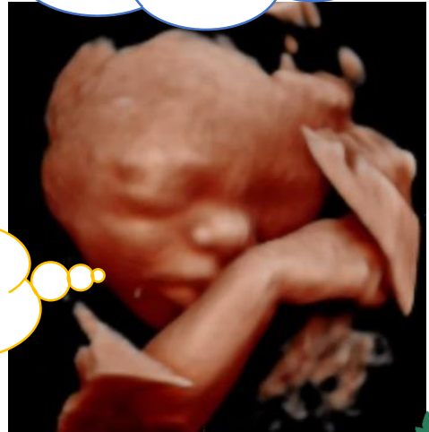
中々お顔を見せてくれ なかったけど、やっと手 をどかして見えたよ！