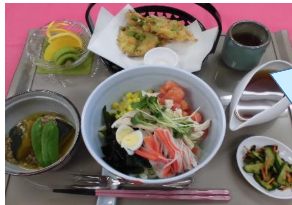
今回はお屋のお食事です！ 冷やし五目うどん、 むきえびと枝豆のかき揚げ、 かぼちゃのそぼろあんかけ、 きゅうりの塩昆布漬けです！ 枝豆はタンパク質もあり、 肝機能の働きを助けてくれ ます(^^)