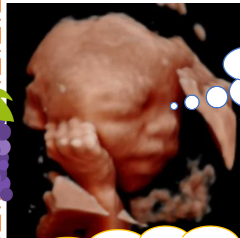
ほっぺに手をあてて、 モデルポーズ♡