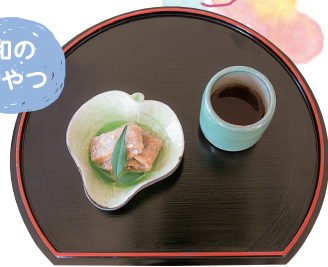
▲この日は「くるみ餅」。おやつも手作りです