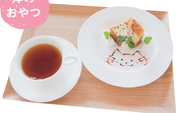
▲この日はかわいい「紅茶のパウンドケーキ」