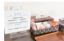
▲ノンカフェインのお茶サービスもうれしい!