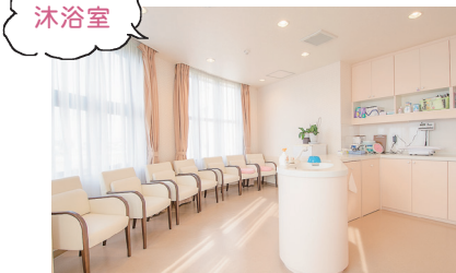
▲沐浴と授乳指導を行う部屋。はじめての出産でもわからないことは丁寧に指導してくれるのがうれしい!