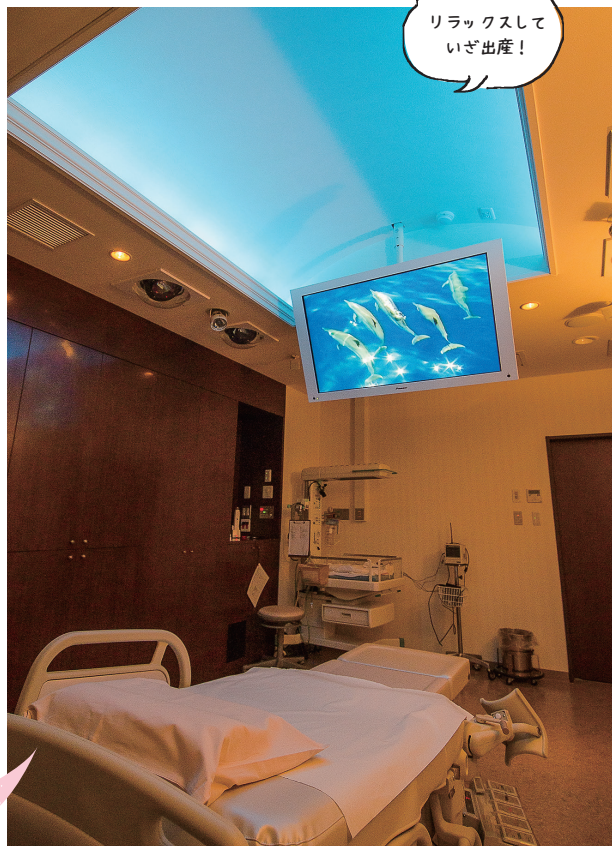
▲お産の不安や緊張を音と光のリラクゼーション機能によってスムーズに和らげる効果が期待できる「Birth Support System」を採用。イルカや緑などの映像をヒーリングミュージックと共に楽しめる。自分の好きなCD・DVDを流してもらうこともできるのでリクエストがある人は持参しよう