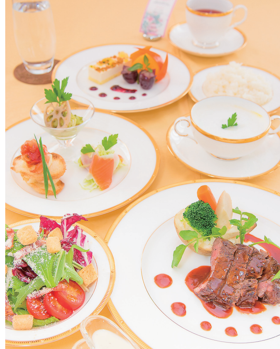
▲院からのプレゼント「お祝い膳」は、夫婦でゆっくりディナーのフルコースを楽しめます。この日は海の幸の3種盛りのおードブル、国産牛のステーキ、カボチャのポタージュ、ケーキと季節のフルーツの盛り合わせ。フレンチ出身のシェフが考案した本格メニューに大満足♪